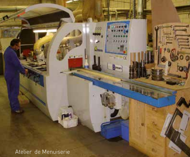
Atelier de Menuiserie