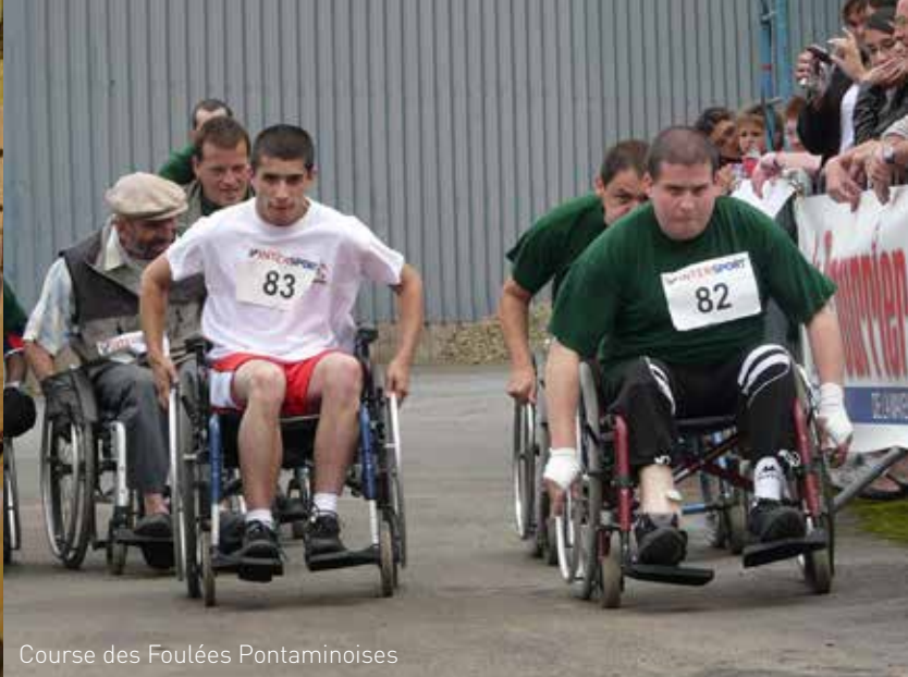
Course des Foulées Pontaminoises