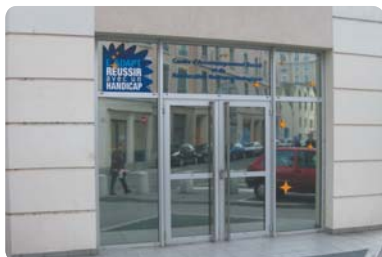
SAMSAH L'ADAPT / Rhône