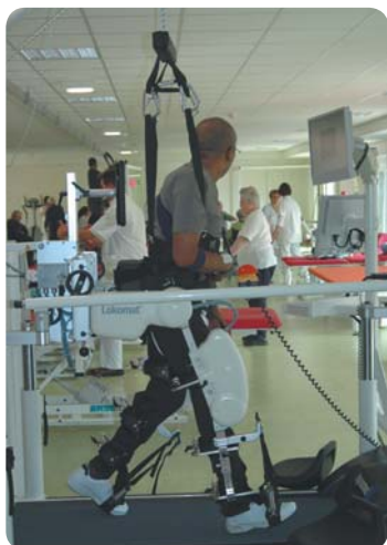
Centre de rééducation L'ADAPT / Loiret