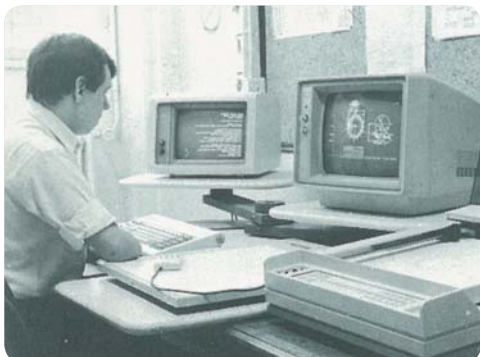
Introduction des ordinateurs dans les établissements de L'ADAPT