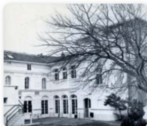
Établissement de Sarcelles