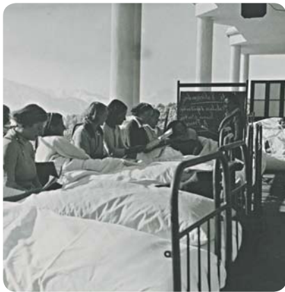
La classe au sanatorium (1936)