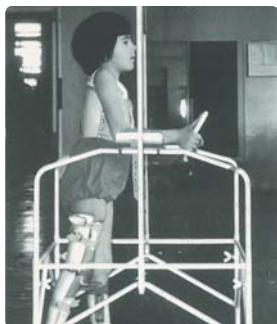
Séance de rééducation