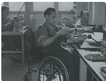
Premiers ateliers occupationnels d'avant-guerre