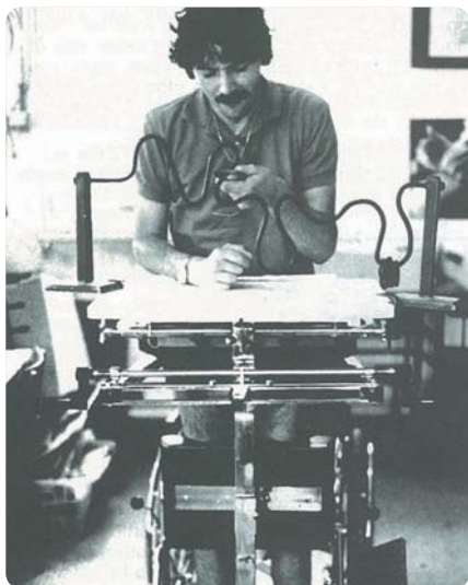
La rééducation fonctionnelle comme moyen de réadaptation au travail