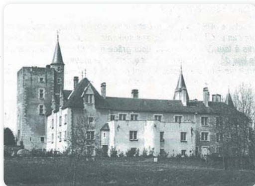
Établissement de Cornusse